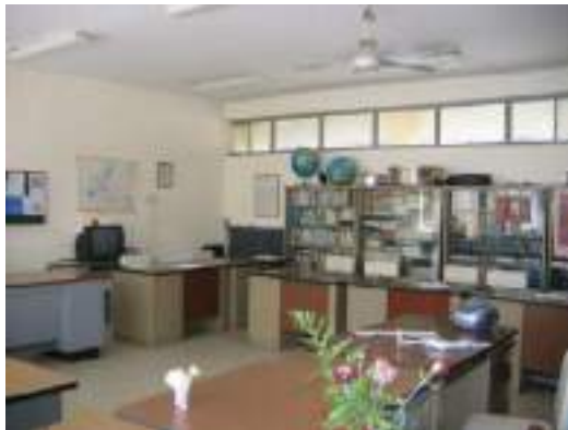
το γραφείο των καθηγητών